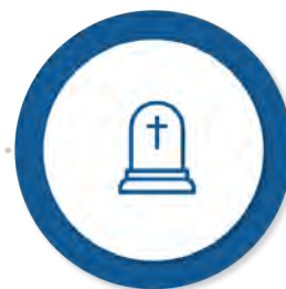
Ajutorul pentru înmormântare