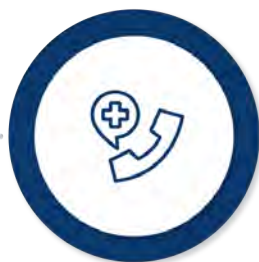
Ajutoarele de urgență (de la bugetul de stat și de la bugetul local)