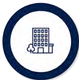
Asigurarea obligatorie pentru locuință

În funcție de nevoile familiei/persoanei singure, venitul minim de incluziune este însoțit de alte drepturi complementare, plătite de la bugetul de stat sau după caz, din bugetul local: